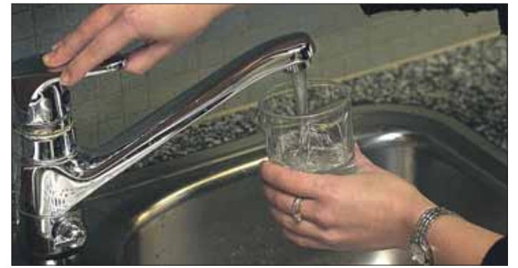
Merirauman alueella saattaa hanoista tulla tänään hetkittäin rusehtavaa vettä, joka ei kuitenkaan ole haitallista.